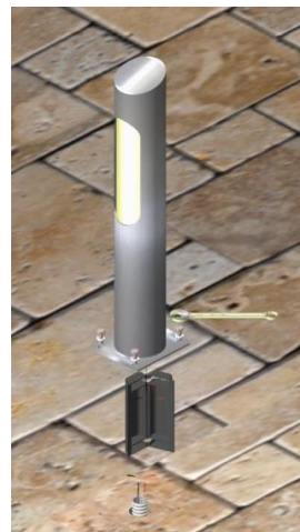
Eeguire il collegamento elettrico in ambiente stagno prestando attenzione alla polarità dei cavi. Fissare a pavimento il corpo illuminante.