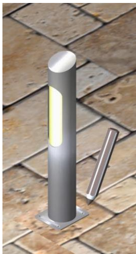
Posizionare il corpo illuminante