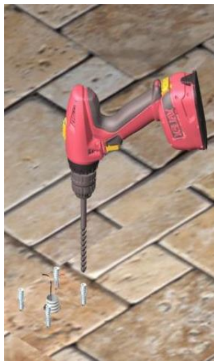
Eeguire fori per sedi viti